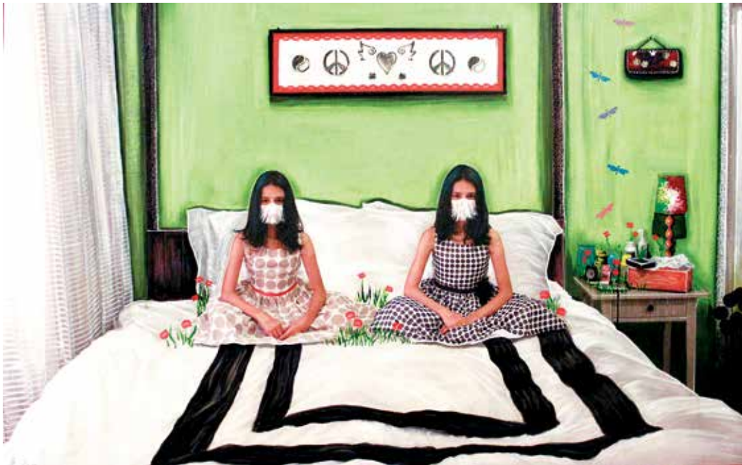
Above: A Tale of Two Muslims