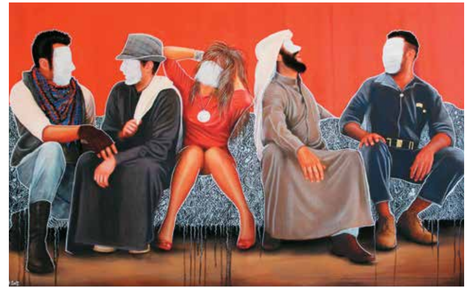
Above: I Need a Hero

For more information, visit www.shurooqamin.com